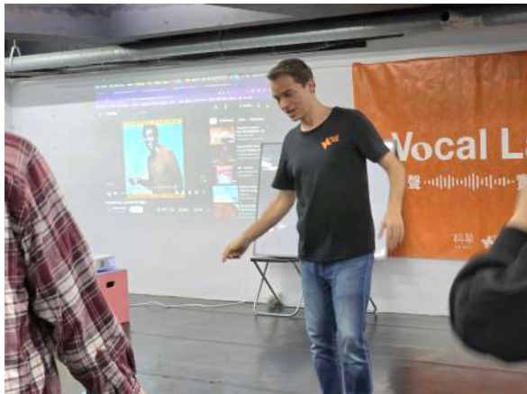
Vocal Lab Season 4 11/30 入門課程 「基礎律動概念 Basic Groove Concept」