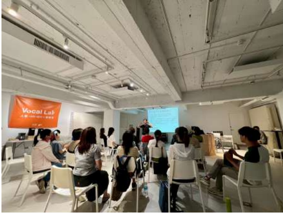
Vocal Lab Season 4 9/28 「流行合唱的聲響與音色融合」 課程進行