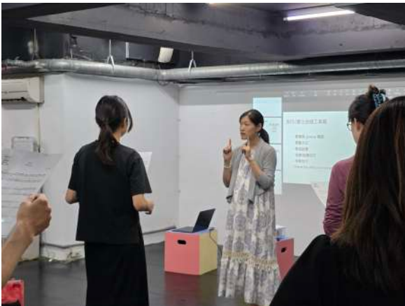
Vocal Lab Season 4 11/30 入門課程 「流行合唱入門 What's Pop Choir?」