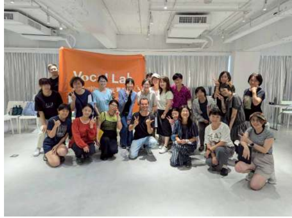
Vocal Lab Season 4 10/19 「Groove與身體的連結」 課後全體學員合影