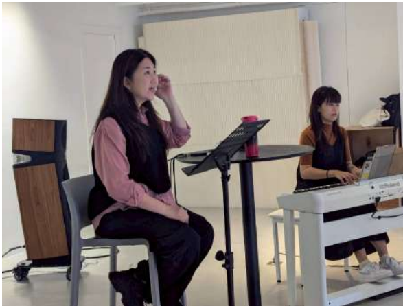
Vocal Lab Season 4 11/9 「中文流行合唱歌曲詮釋」 課程進行